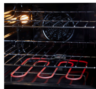
Four à convection