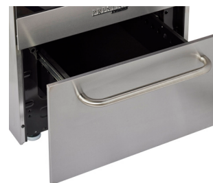
Tiroir de rangement