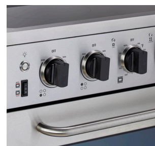
Boutons modernes conçus pour une utilisation facile