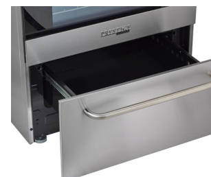
Tiroir de rangement