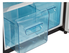
4 tablettes en verre et 2 bacs à légumes